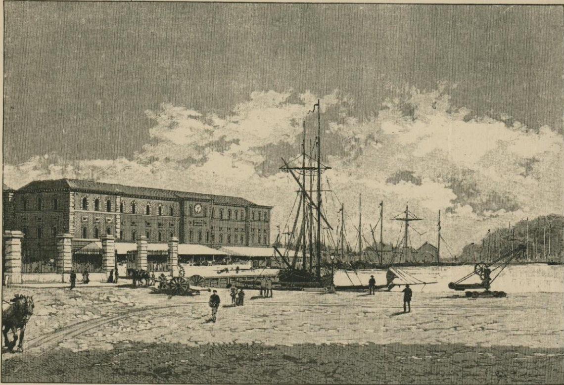
L'ENTREPÔT DE BRUXELLES. Dessin de Louis Titz.

M. Wvns de Raucour. Les plans en étaient dus à M. Spaak, architecte de la province. Le nouvel entrepôt, d'allures massives, est d'un imposant aspect. Il a le mérite d'être admirablement adapté à sa destination. L'inauguration en eut lieu le 26 septembre 1851. Le 1 er octobre 1846, les bureaux de la douane y avaient été installés. En 1847, ses immenses salles servirent à l'exposition des produits de l'industrie nationale.